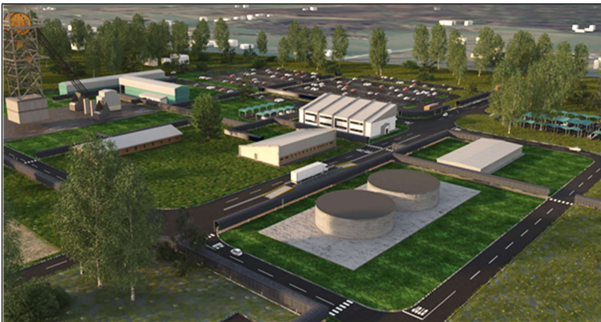
Wizualizacja kopalni Jan Karski